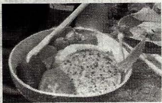
Preparing a vegetarian lunch.