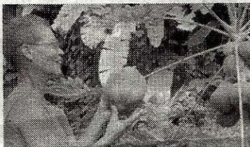
A hands-on gardening experience.