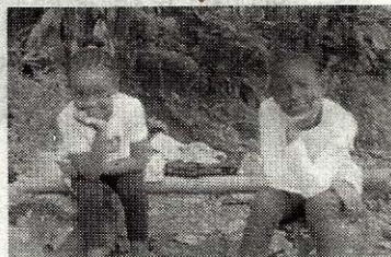
Chilling out in Charlotteville.