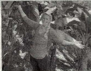
Basking in Mother Nature.