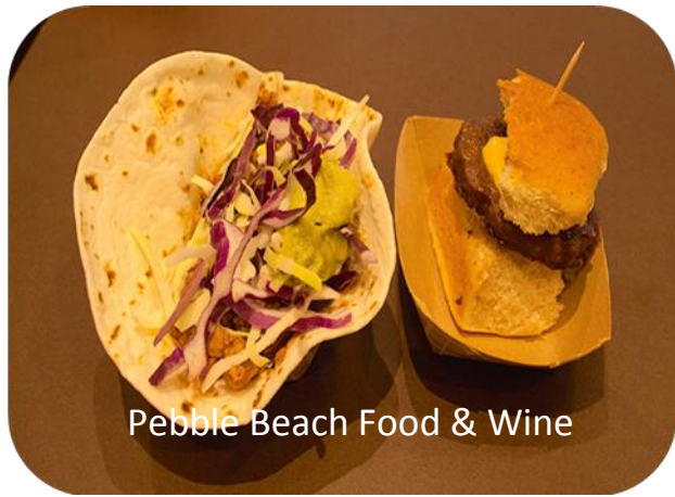
Pebble Beach Food & Wine