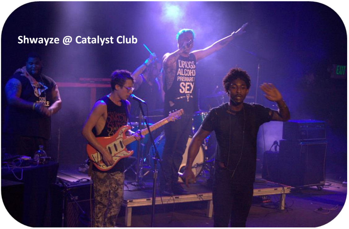
Shwayze @ Catalyst Club