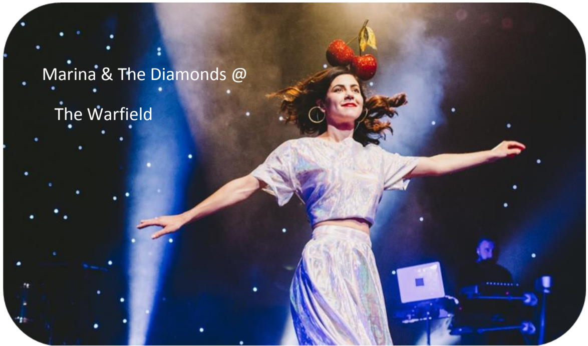
Marina & The Diamonds @ The Warfield