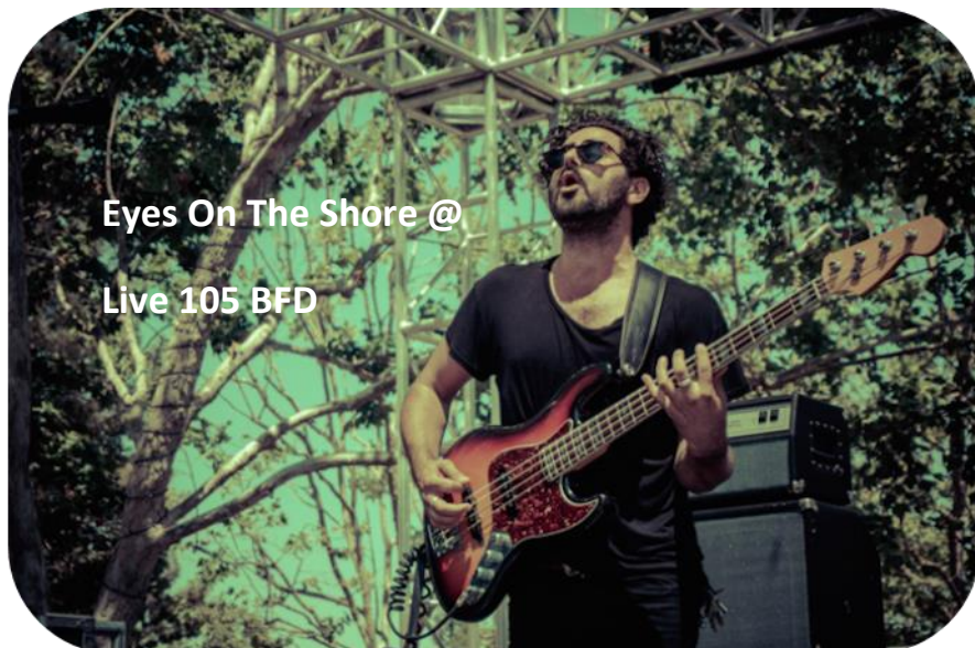
Eyes On The Shore @ Live 105 BFD